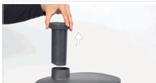
3. Indepartati pusher-ul.