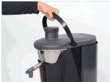
1. Ridicati manerul de siguranta