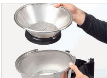
8. Scoateti sita din carcasa