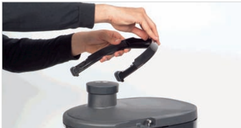
2. Scoateti manerul de siguranta (puneti-l orizontal si trageți in directia opusa)