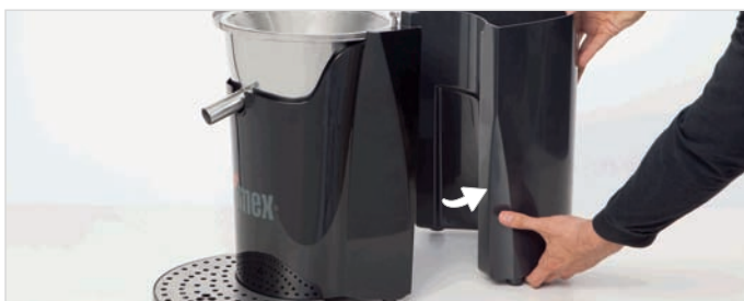
6. Scoateti cosul de gunoi, tragand orizontal.