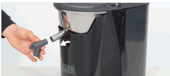
4. Scoateti robinetul, tragand de el.