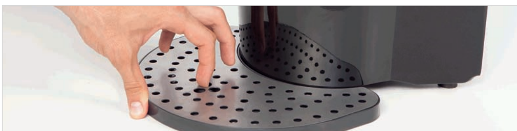
9. Indepartati sita de la suportul de pahare, cu ajutorul degetelor.