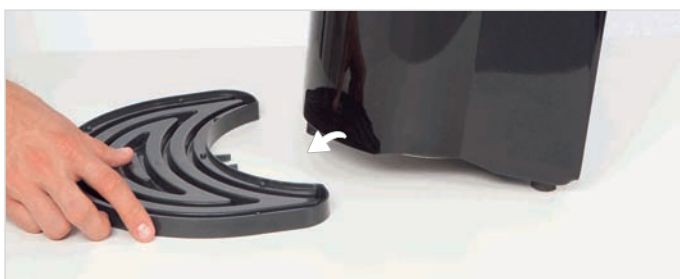
10. Scoateti si suportul pentru pahare.