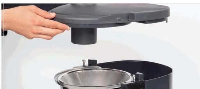
5. Luati capacul superior.